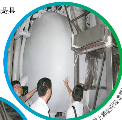
高溫染色機表面塗上節能保溫塗層後

保溫塗料以噴塗方式覆蓋設備表面約3mm厚，能應用在260°C以下任何物質的表面，但事先需要以梘油等工業清洗劑清洗表面油污，待保溫噴塗表面乾燥後才施工。施工時為避免橘皮效果產生，必須配用一台專用的高壓噴塗機(型號 TEXSPRAY 7900HD)，以得到平塗及較理想的施工效果。