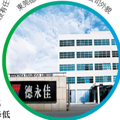
東莞德永佳紡織制衣有限公司外觀